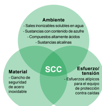
Figura 1. Efecto de los factores de material, ambiente y esfuerzo/tensión en el SCC en los dispositivos de protección contra caídas

formación gradual de microgrietas en los metales, debido a una exposición simultánea a esfuerzos (por fuerzas/cargas aplicadas) y a sustancias solubles en agua como sales, así como a sustancias de naturaleza fuertemente ácida o alcalina/cáustica. Estos agentes pueden ser líquidos, o dispersos en nieblas, vapores o formas gaseosas. Como se ilustra en la Figura 1, el SCC es el efecto combinado de tres factores: a) composición de aleación metálica, b) naturaleza del o los agentes químicos y c) nivel de esfuerzo cíclico o constante aplicado (así como duración de la exposición) resultando en reducción de resistencia.