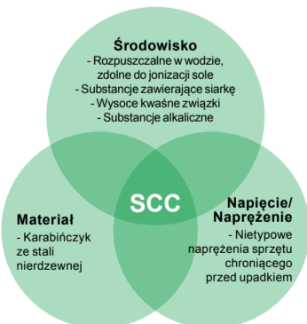
Rysunek 1. Wpãlyw materiaãw, sãrodowiska i napiãcia/nãprãżenia na SCC w urzãdzeniach chroniãcych przed upadkiem

SCC to powstawanie i powolny rozrost mini-pãkniãã w metalach, z powodu rãwnoczesnego nãrãżenia