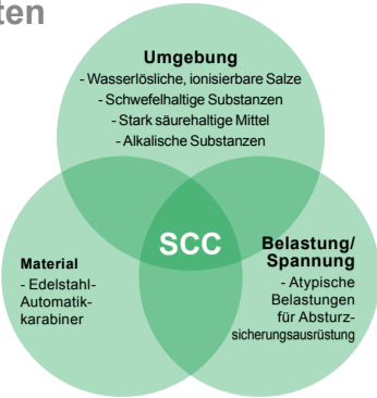
Abbildung 1. Einfluss von Material-, Umgebungs- und Belastungs-/Spannungsfaktoren auf SCC in Absturzschutzgeräten

SCC sind die Entstehung und das langsame Ausweiten von Mikrorissen in Metallen aufgrund einer Belastung (von einer einwirkenden Kraft/Last) und der gleichzeitigen Belastung