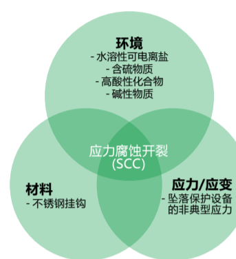
图 1. 材料、环境和应力/应变因素对坠落保护设备应力腐蚀开裂 (SCC) 的影响

应力腐蚀开裂 (SCC) 是指金属出现微裂纹并缓慢增多的现象，产生这种现象的原因是由于金属同时暴露于应力 (来自作用力/负载) 和某些水溶性物质条件下，例如盐和