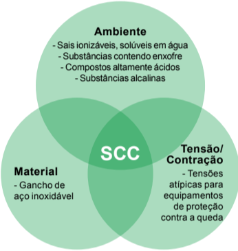
Figura 1. Influência de fatores do material, do ambiente e de tensão/contração sobre SCC em dispositivos de proteção contra a queda

SCC é o surgimento e o crescimento lento de microfissuras em metais, causados por exposição simultânea à tensão (de uma força/carga aplicada) e a certas substâncias solúveis em água, como sais, além de substâncias extremamente ácidas ou alcalinas/caústicas por natureza. Esses agentes podem ser líquidos, ou dispersos em forma de neblina, vapor ou gases.